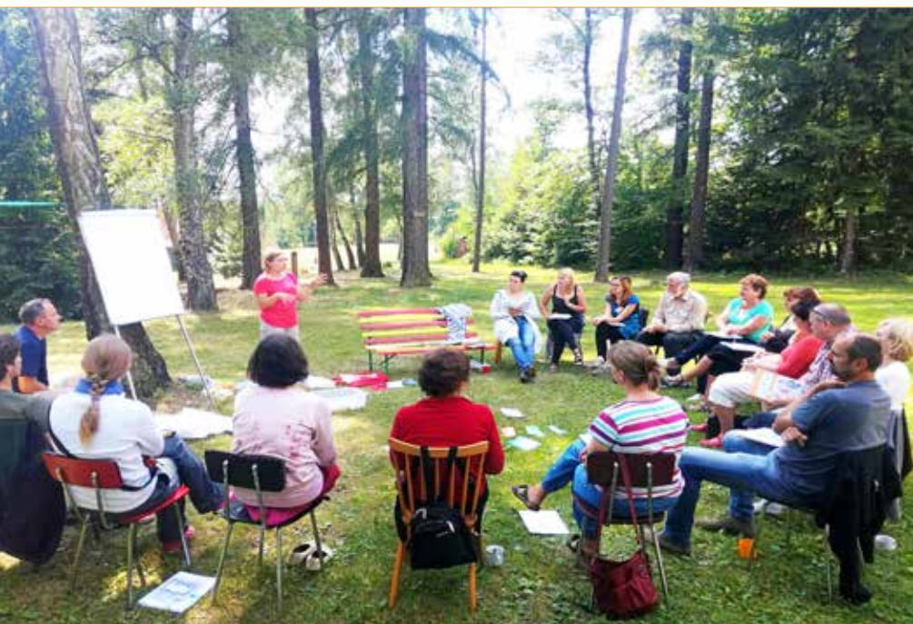
Neformální prostředí Letní školy GRV

V červenci 2018 pořádal NIDV Letní školu globálního rozvojového vzdělávání. Prázdninový pobyt byl určen všem učitelům, pedagogům volného času, vychovatelům a pracovníkům NNO věnujícím se tématům spojeným s GRV. Cílem kurzu bylo seznámit účastníky s problematikou výchovy k občanství v místních a celosvětových souvislostech, prohloubit jejich znalosti zvláště v oborech mediální a ekologické výchovy a motivovat je k aktivní angažovanosti v této oblasti. Kromě přednášek a konzultací měli účastníci možnost absolvovat praktické ukázky lekcí využitelných při práci s dětmi a sdílet vzájemně své zkušenosti. Zajímaly nás jejich názory, a proto jsme několik účastnic tohoto kurzu požádali o rozhovor.