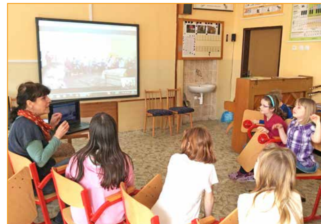
Skypování se zahraničními kamarády