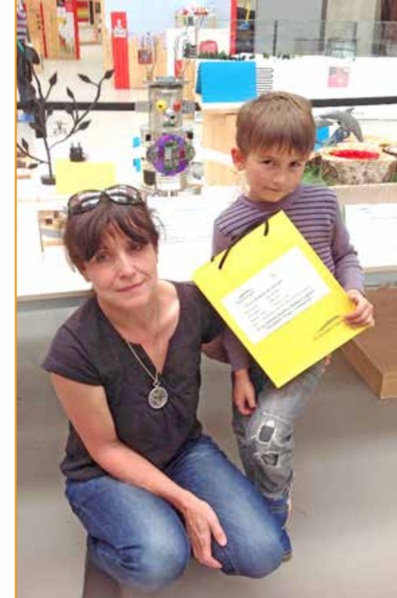
Ocenění v Techmání

Každý den jsem s dětmi a stále si uvědomuji tu velkou zodpovědnost, že mi rodiče svěří své ratolesti a já je svým postojem a jednáním ovlivňuji a někam směřuji. Do družiny ke